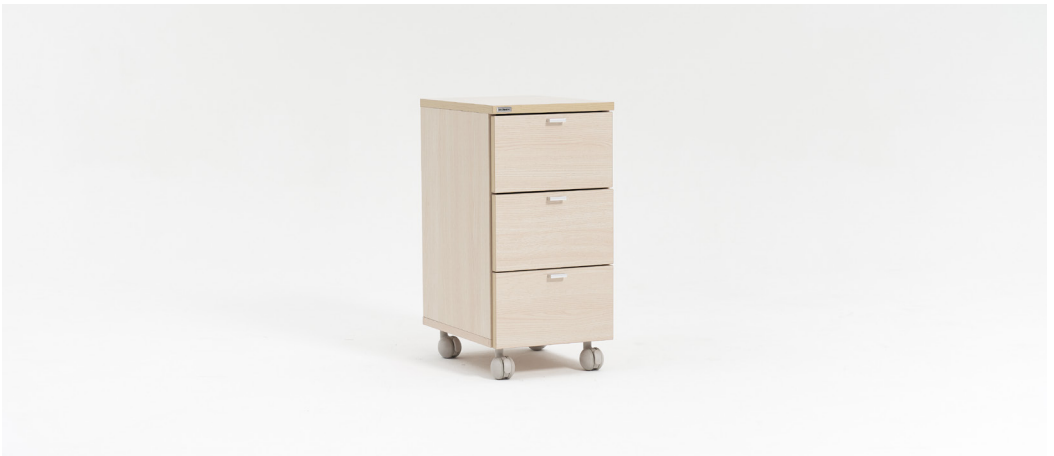
| E1. 서랍통3040OA / 001DW3040OA 300 x 400 x 600mm FINISH | 오크 LPM