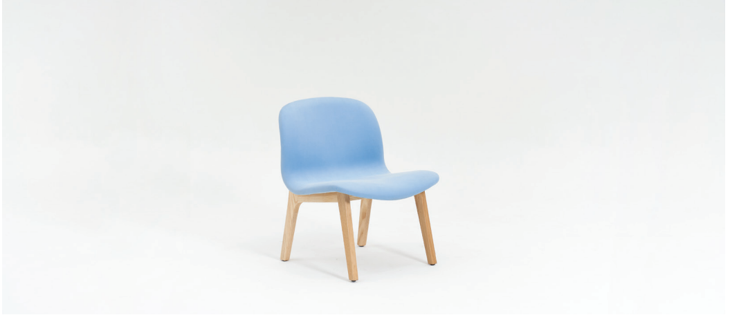
| E1. 라운지체어B / 009CH01B 620 x 610 x 760mm FINISH | 블루 패브릭 + 오크