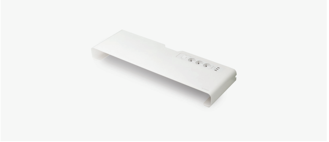
| 모니터 받침대A / 003MS7523W 750 x 240 x 78mm FINISH | 화이트 스틸