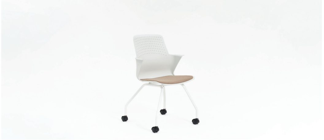
| E1. 노브M체어W / 006CHA03W 540 x 540 x 855mm FINISH | 화이트PP + 베이지 패브릭