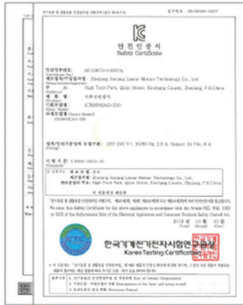
전기용품 및 생활용품 KC 안전인증서 전자파 적합등록 필증