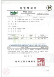
상판 E0등급 KOFPI 시험성적서