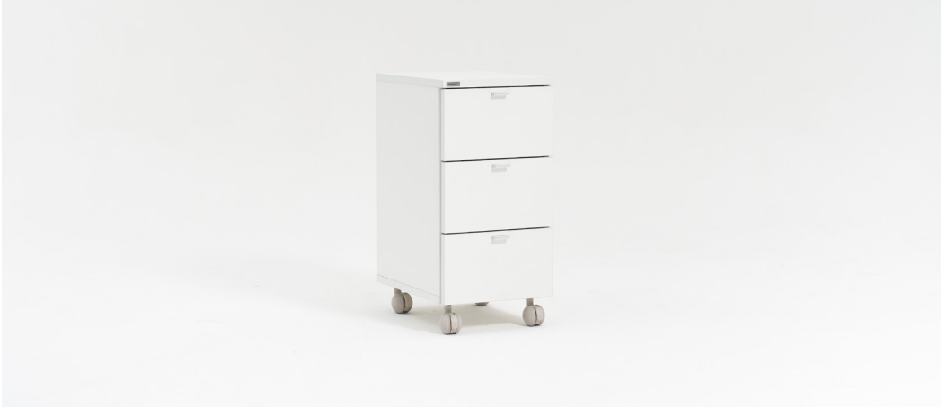
| E1. 서랍통3040W / 001DW3040W 300 x 400 x 600mm FINISH | 화이트 LPM