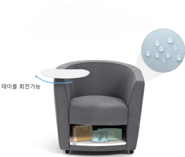
수납공간 사이즈 470mm x 210 mm

관리가 쉬운 발수 패브릭을 사용하였습니다. 원단에 액체가 스며들지 않아 마른 천으로 닦아 내기만 하면 손쉽게 관리 및 청소가 가능합니다.