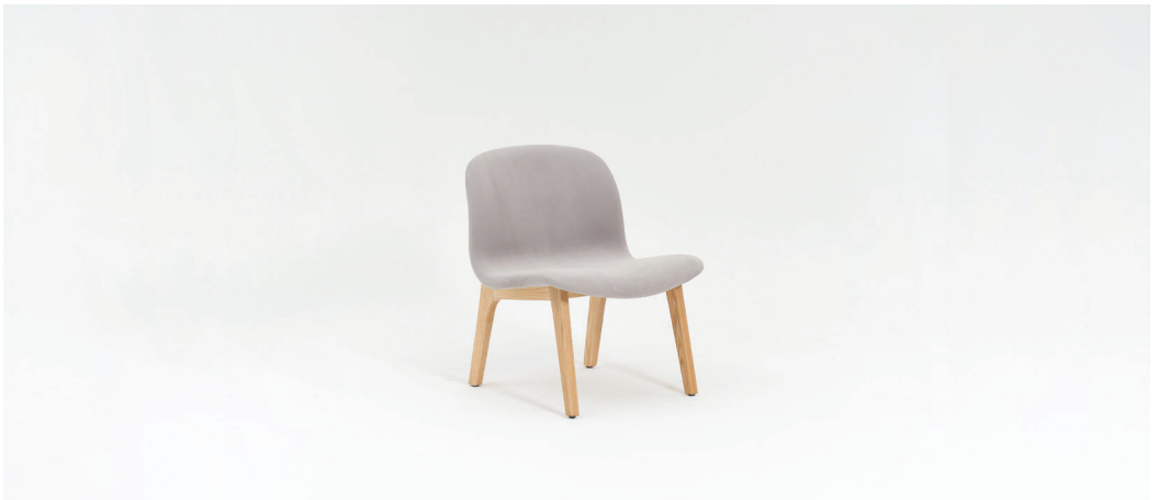
| E1. 라운지체어GY / 009CH01GY 620 x 610 x 760mm FINISH | 그레이 패브릭 + 오크