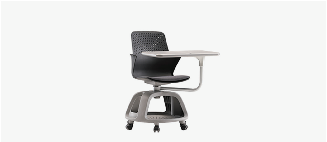
| E1. 노브체어BK / 006CHA01BK 670 x 850 x 910mm FINISH | 블랙 & 그레이PP + 그레이 패브릭