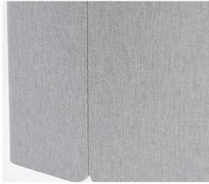
자사 브라켓 없이 고정

튀어나온 볼트나 외부로 노출되는 브라켓 없이 고정할 수 있어, 타 제품보다 시각적으로 걸림이 없고 모던합니다.