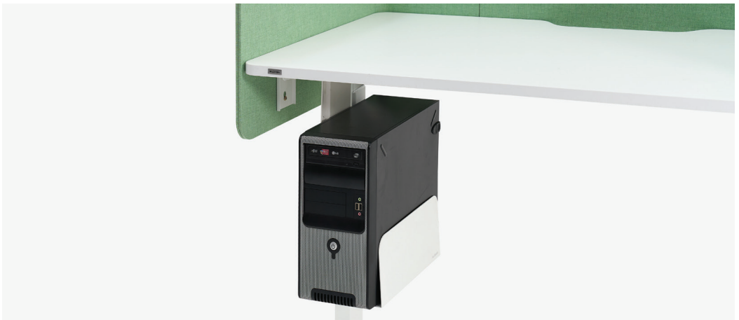
| PC 행잉 거치대B / 003ACA3030W 300 x 306 x 490mm FINISH | 화이트 스틸