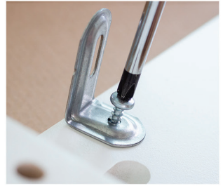
타사 나사 혹은 브라켓으로 고정