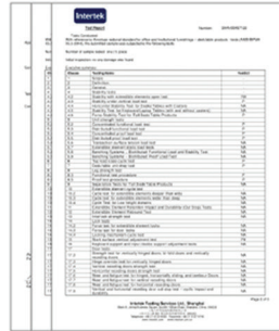
책상 지지 하중 및 안정성 Intertek 시험성적서