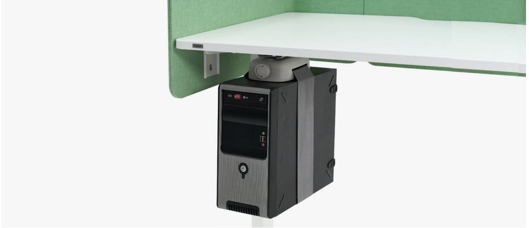
| PC 행잉 거치대A / 005ACA2513GR 250 x 140 x 340mm FINISH | PP+벨트