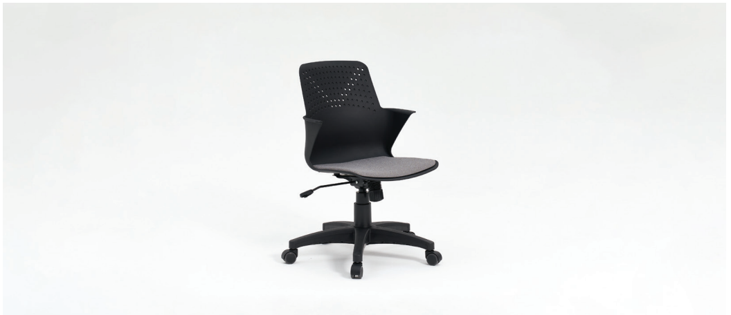
| E1. 노브S체어BK / 006CHA02BK 535 x 525 x 835mm FINISH | 블랙PP + 그레이 패브릭