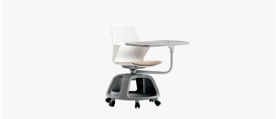
| E1. 노브체어W / 006CHA01W 670 x 850 x 910mm FINISH | 화이트 & 그레이PP + 베이지 패브릭