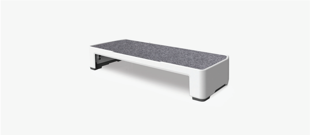
| 모니터 받침대B / FF103 573 x 240 x 108~123mm FINISH | 화이트 PP + 그레이 매트